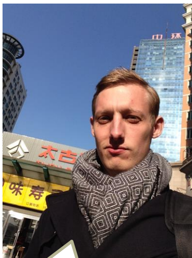
Solskinsdag udenfor mit favorit restaurant.