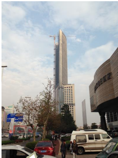
En ud af de hundredvis nye smarte højhuse under bebyggelse