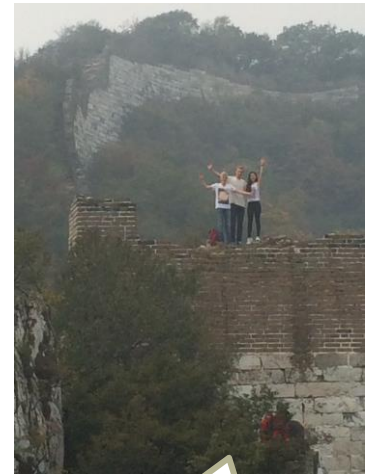
Billede fra den Kinesiske mur nord for Beijing