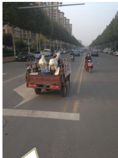
Mit lokale kvater(Li Cang) og en lokal bondemand der sælger gedemælk