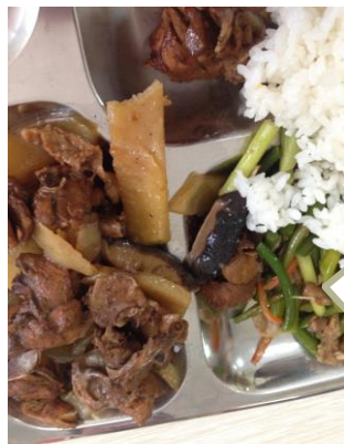
Den daglige kantine mad hos PMC Qingdao. Ris, stegte grønsager samt hakket kylling