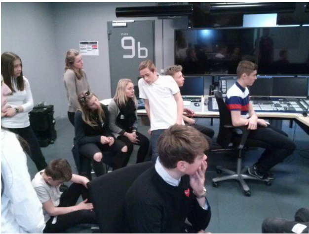
Trætte - men stadig interesserede!